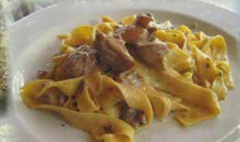
Le specialità gastronomiche Gastronomical traditions