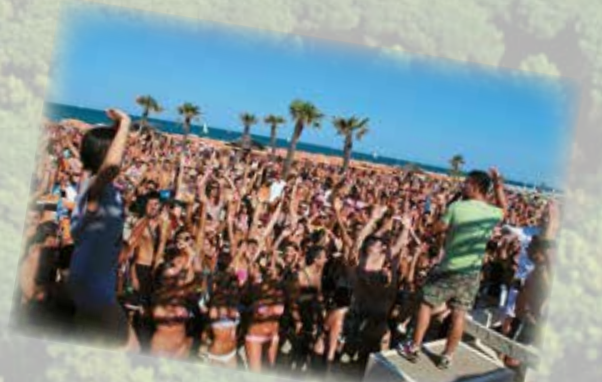
Feste sulla spiaggia Parties on the beach