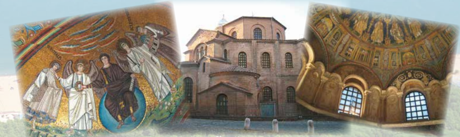
Ravenna, città d'arte e cultura bizantina, dichiarata dall'Unesco Patrimonio dell'Umanità (8 km) Ravenna, famous for its byzantine treasures, a Unesco World heritage site