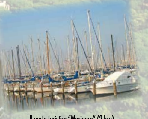
Il porto turistico "Marinara" (2 km) The port for tourists "Marinara"