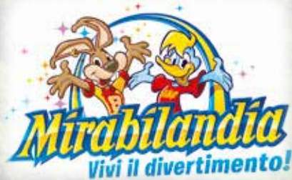
A soli 15 minuti da Mirabilandia, uno dei parchi divertimento più belli e divertenti d'Europa Just 15 min. far from Mirabilandia, one of the best and most amusing fun parks all over Europe