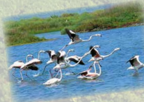
Birdwatching nel parco del Delta del Po Birdwatching in the Po Delta Park