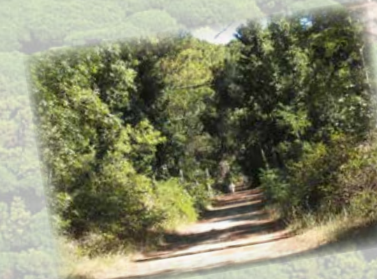
La pineta, ideale per mantenersi in forma (0,00 km) The pinewood, ideal for jogging